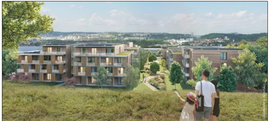
Ökologisch und ökonomisch sollen die Personalwohnungen für das Klinikum werden

Aktivhaus wird für die städtische Wohnungsgesellschaft SWSG ein Energiehaus-Plus-Quartier errichten. Es ist das bisher größte Projekt für serielles Bauen nach dem GdW-Rahmenvertrag in Deutschland.